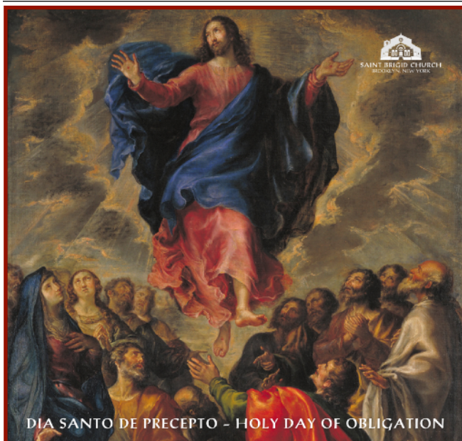
DIA SANTO DE PRECEPTO - HOLY DAY OF OBLIGATION